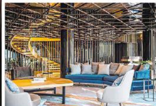
Hotel Almanac Barcelona: Die Rooftop-Bar und der Pool auf der Dachterrasse bieten einen imposanten Blick auf die Stadt. Das Leben auf dem Gran Via Boulevard kann man vom Zimmersofa aus beobachten